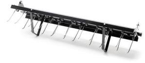
ГРАБЛІ HUSQVARNA ДЛЯ МОХУ_ 102СМ 586 63 68-01