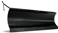
ВІДВАЛ СНІГОВИЙ; 122СМ 544 92 17-01