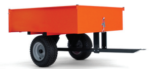
ПРИЧІП PROFІ 953 51 17-02