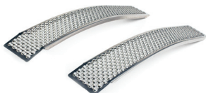
TRO050 - LOADING RAMP 505 69 90-43