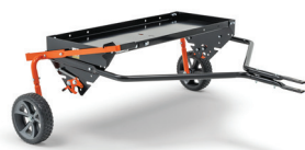
БАЗОВА ПЛАТФОРМА 586 63 72-01