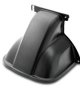
ДЕФЛЕКТОР 960 71 00-41