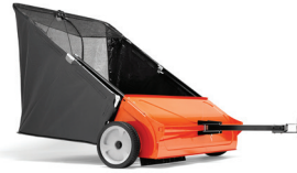
СМІТТЄЗБИРАЧ_ 112СМ 586 63 65-01