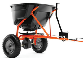
РОЗКИДАЧ ДОБРИВ 967 02 72-01