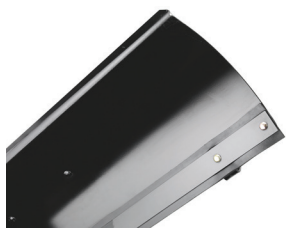
НАКЛАДКА ГУМОВА 966 00 19-01