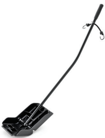
ТR0060 - ВСТАВКА МУЛЬЧУЮЧА 960 71 00-38