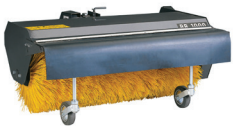
ТR0040 – ПЕРЕДНЯ ЦИЛІНДРИЧНА ЩІТКА 544 92 16-01