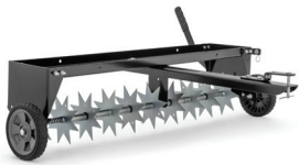
АЕРАТОР HUSQVARNA_ 102СМ 586 63 69-01