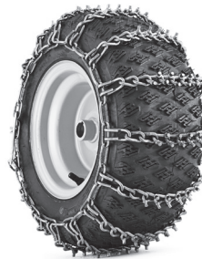
ЛАНЦЮГИ HUSQVARNA НА КОЛЕСА (ПАРА)_ 3 ШИПАМИ 964 99 43-01